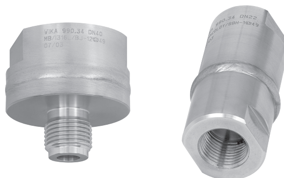
Модель 990.34 Mb 40 мм резьба G 1/2 В (наружная)